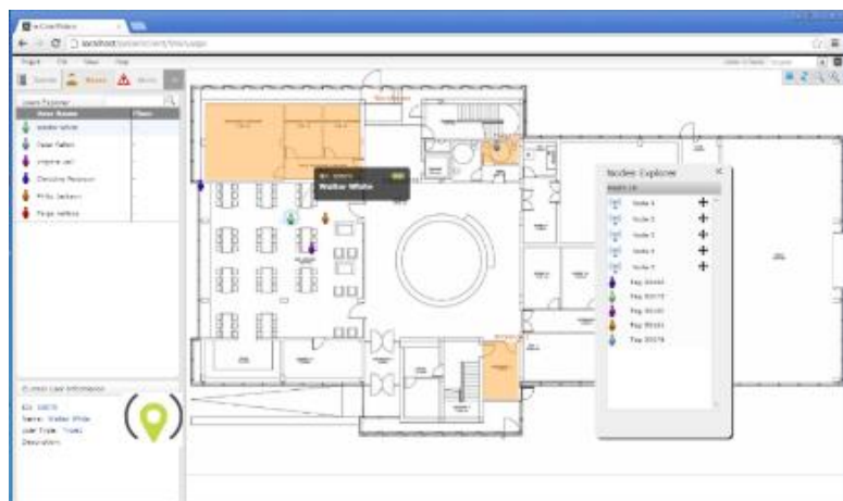
Logiciel de visualisation